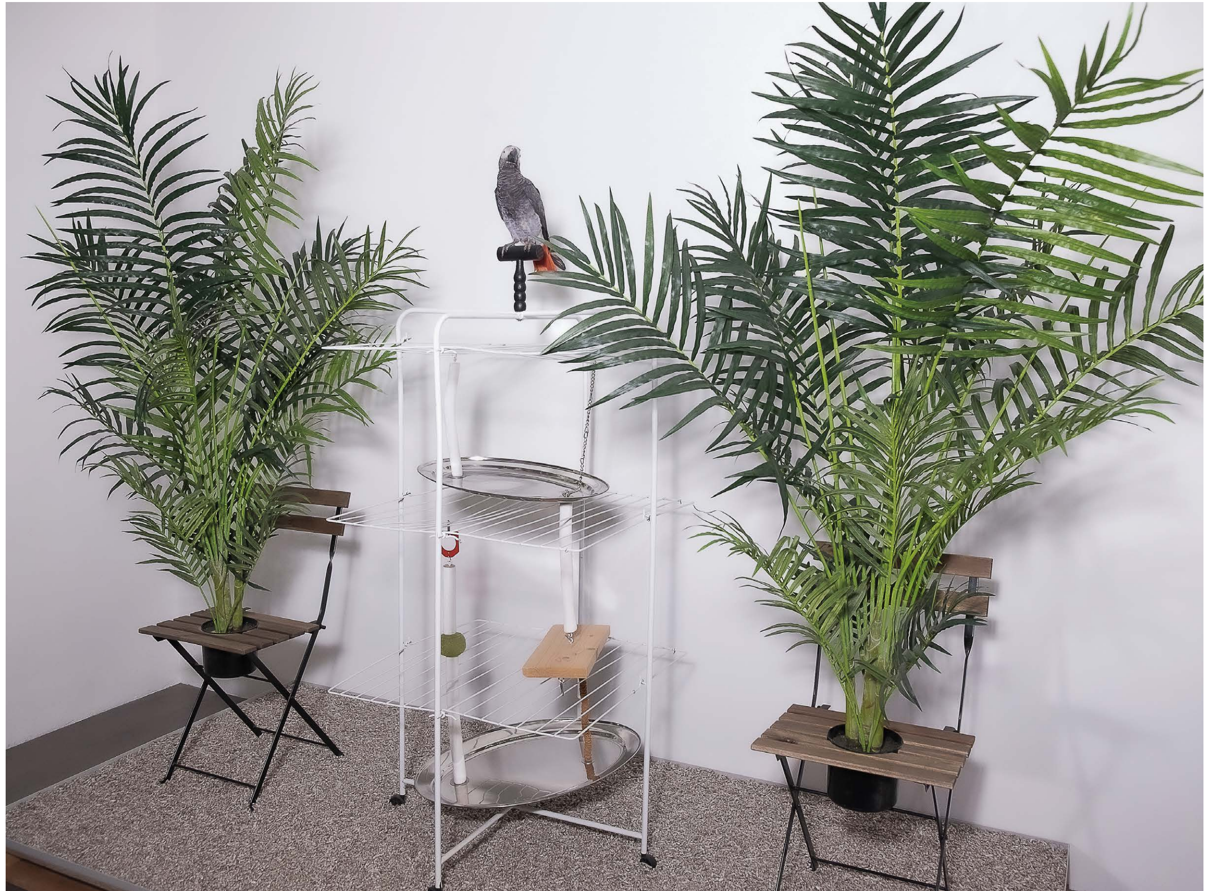
Parrotism , 2019. Technique mixte. 250 × 120 × 200 cm. Perroquet gris naturalisé, étendoir à linge, perchoirs, jouets pour oiseaux, plateaux de service en inox, chaises pliantes, faux palmiers, litière pour animaux, palette en bois, cornières PVC gris, bande sonore. Parrotism , 2019. Mixed media. 250 × 120 × 200 cm. Stuffed grey parrot, drying rack, perches, toys for birds, stainless steel serving tray, folding chairs, fake palm trees, pet litter, wood pallet, grey PVC corner, soundtrack.