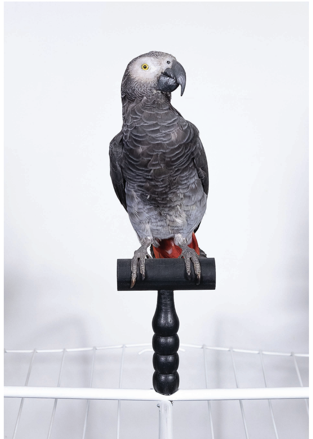
Parrotisme (détail) , 2019. Perroquet gris naturalisé présenté sur un perchoir en bois peint. Hauteur 40 cm. Parrotism (detail) , 2019. Stuffed grey parrot on a perch in painted wood. Height: 40 cm.