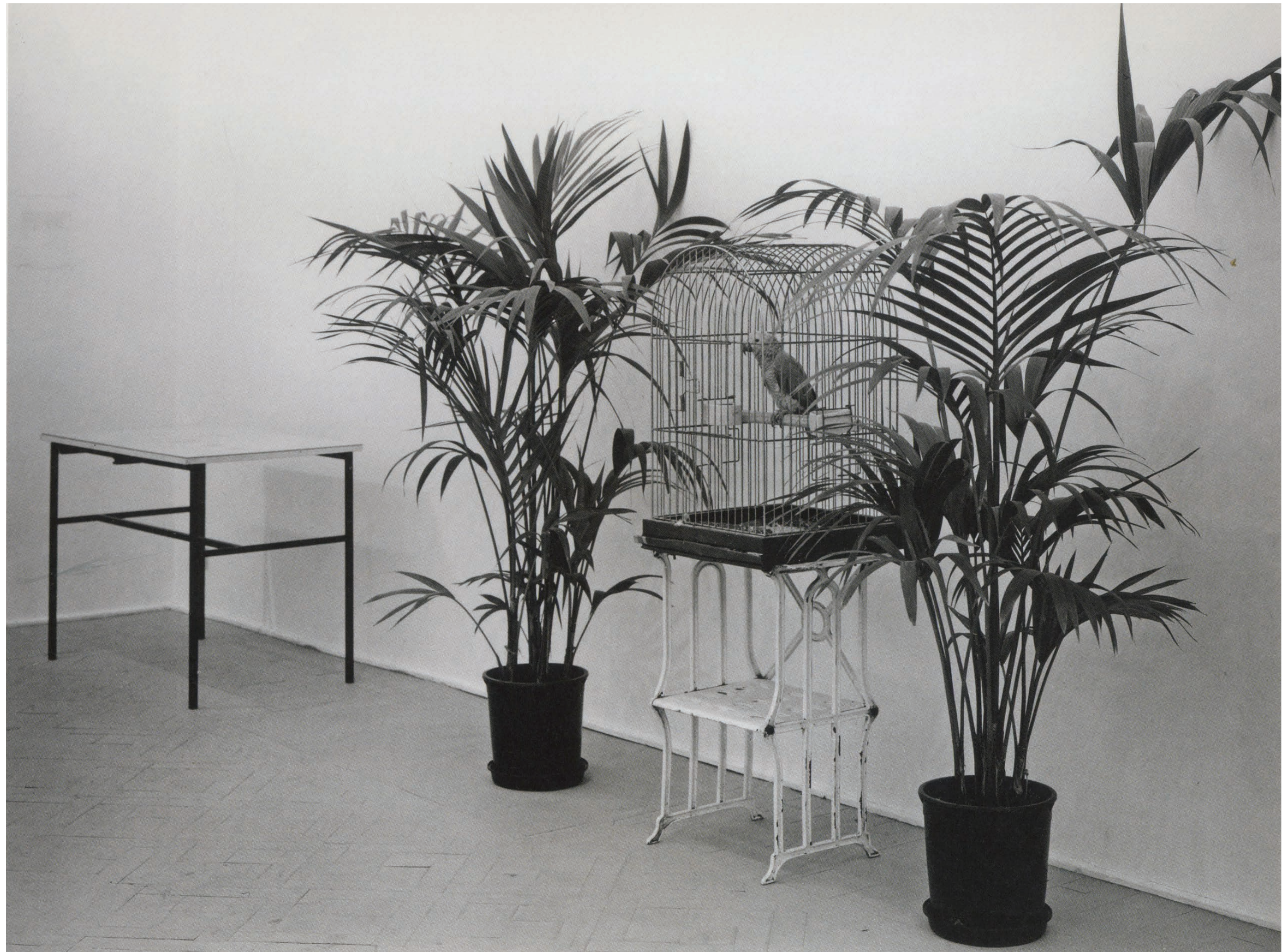
Marcel Broodthaers , Ne dites pas que je ne l'ai pas dit. Le Perroquet , 1974, technique mixte. 300 × 70 × 175 cm. Magnétophone diffusant le poème Moi Je dis Je, moi Je dis Je... lu par l'artiste. Vue de l'exposition au Wide White Space Gallery, Anvers, 1974. ( Don't Say I Didn't Say So—The Parrot ), 1974, mixed media. 300 × 70 × 175 cm. Tape recorder broadcasting the poem 'Moi Je dis Je, moi Je dis Je...' read by the artist. View from the exhibition at the Wide White Space Gallery, Antwerp, 1974.