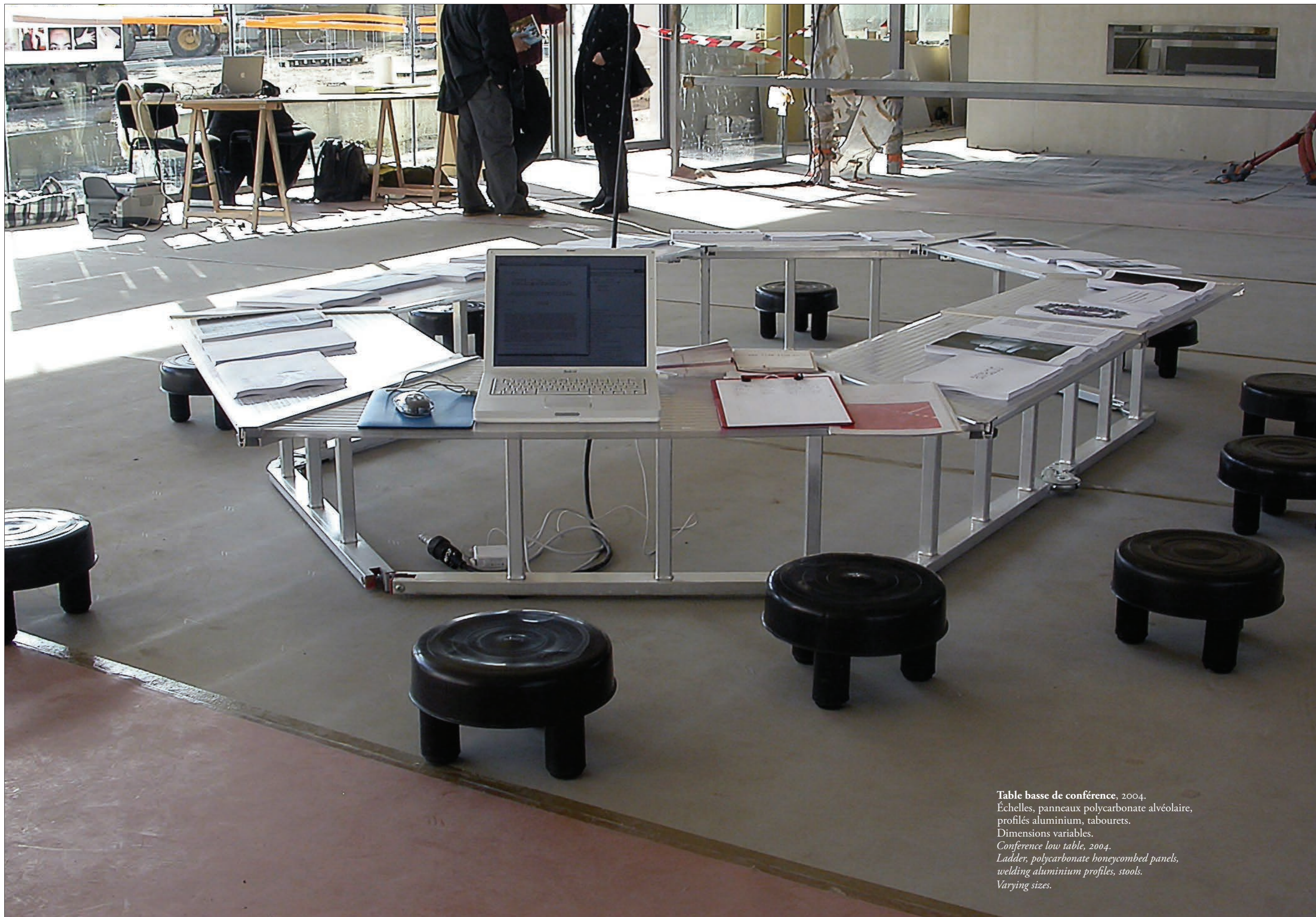
Table basse de conférence, 2004. Échelles, panneaux polycarbonate alvéolaire, profilés aluminium, tabourets. Dimensions variables. Conference low table, 2004. Ladder, polycarbonate honeycombed panels, welding aluminium profiles, stools. Varying sizes.