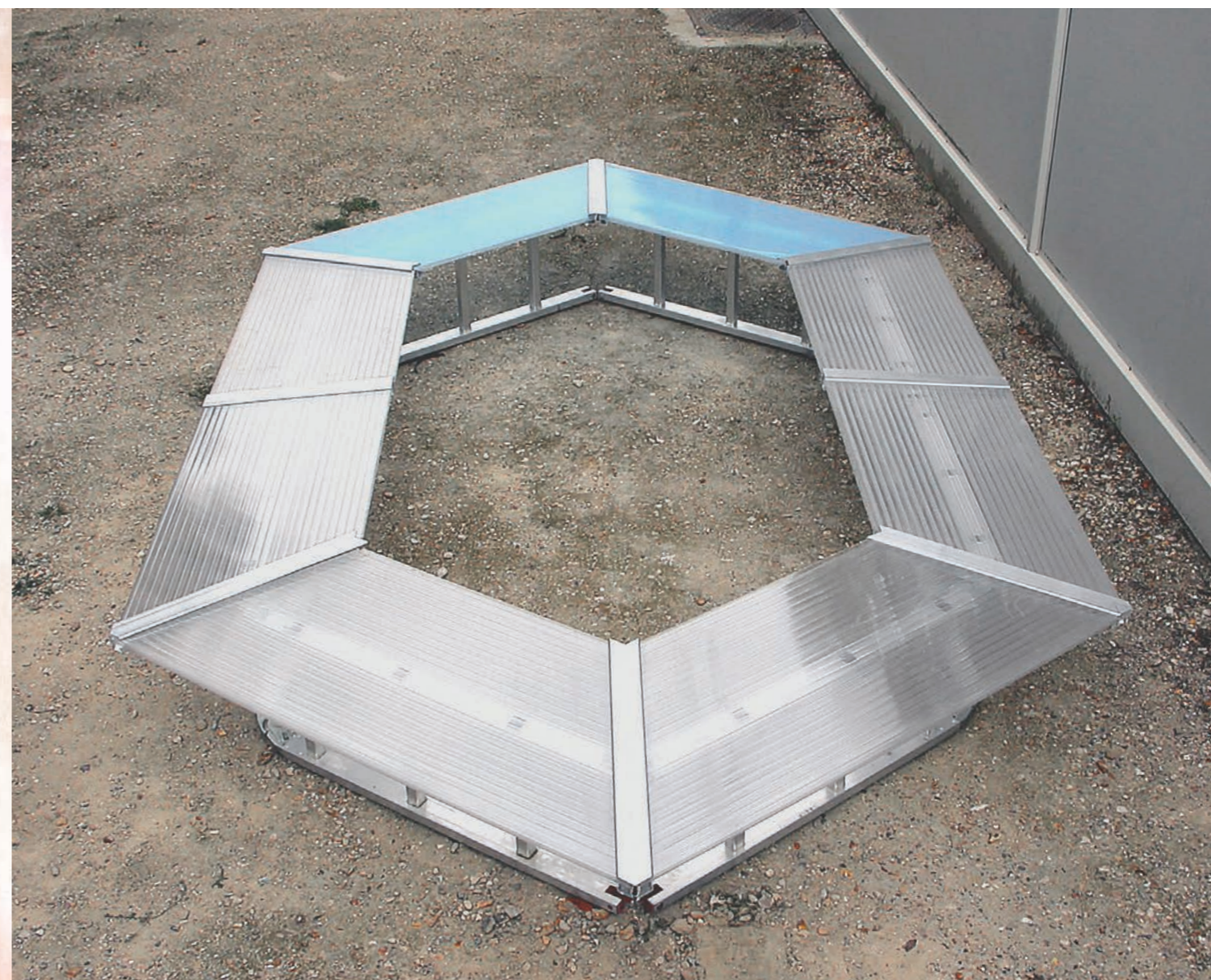
Table basse de conférence, un dispositif de Remy Bosquère, 2004

Jusqu'en avril 2004, THE STORE a développé dans sa galerie parisienne une série de projets collectifs. La programmation, à la croisée de diverses disciplines, a vu succéder des expositions stricto sensu mais aussi des performances ou des projections vidéo.