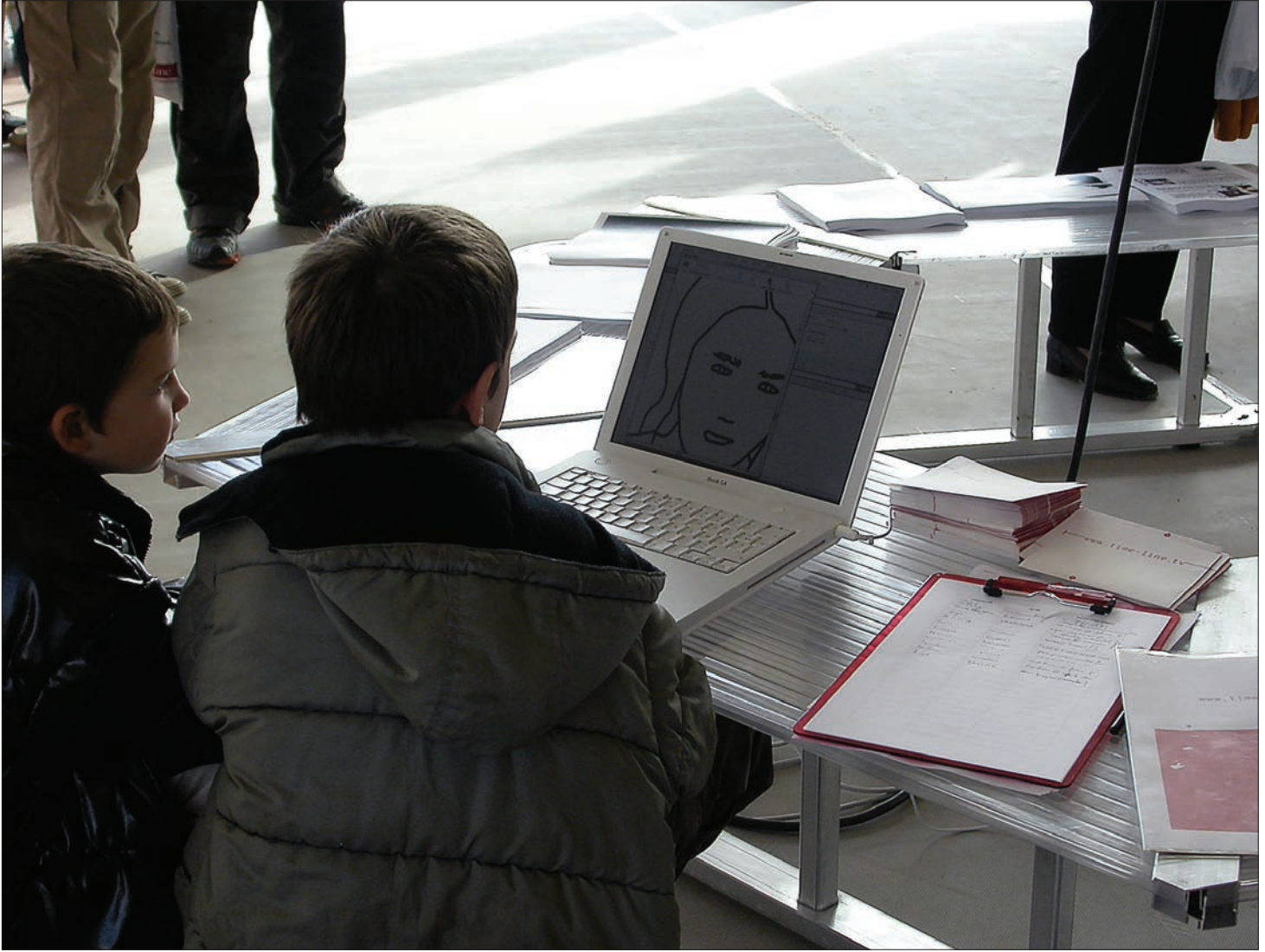
Hall du MAC VAL, Vitry-sur-Seine. MAC VAL hallway, Vitry-sur-Seine.