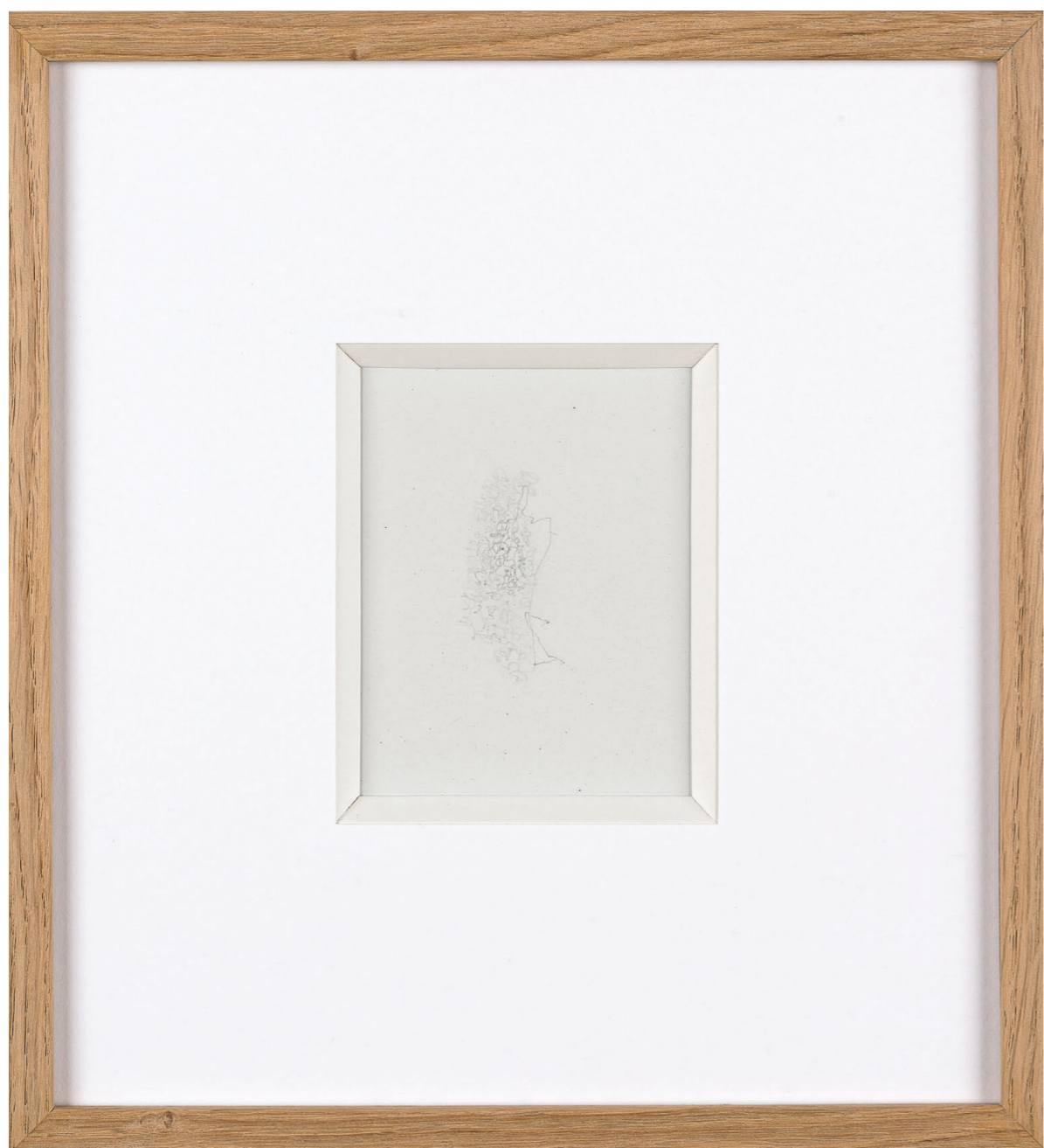
Tartre , 2015. Dessin sur papier réalisé avec une brosse à dent électrique. 27 × 30 × 3 cm. Tartar , 2015. Drawing on paper made with an electric toothbrush. 27 × 30 × 3 cm.