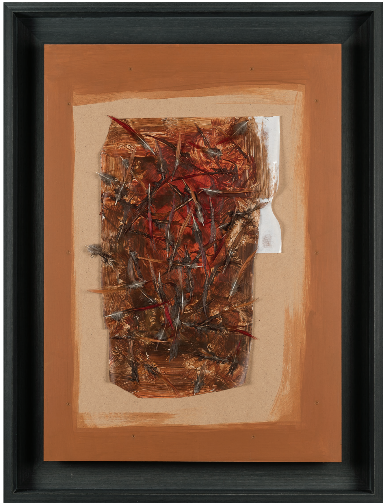
Faisandage , 2014. Peinture et plumes sur papier contrecollé sur bois peint. 63 × 83 × 8 cm. Hanging , 2014. Painting and feathers on paper laminated on painted wood. 63 × 83 × 8 cm.