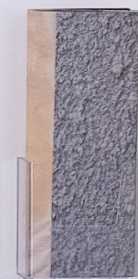
Étalage mural, 2020. 9 éléments. Dimensions variables. Wall display, 2020. 9 pieces. Variable dimensions.