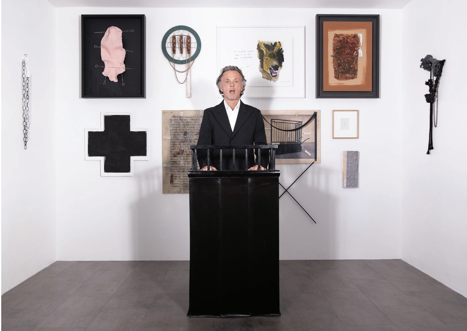
Vues de l'atelier, Vitry-sur-Seine. Views of the studio, Vitry-sur-Seine.