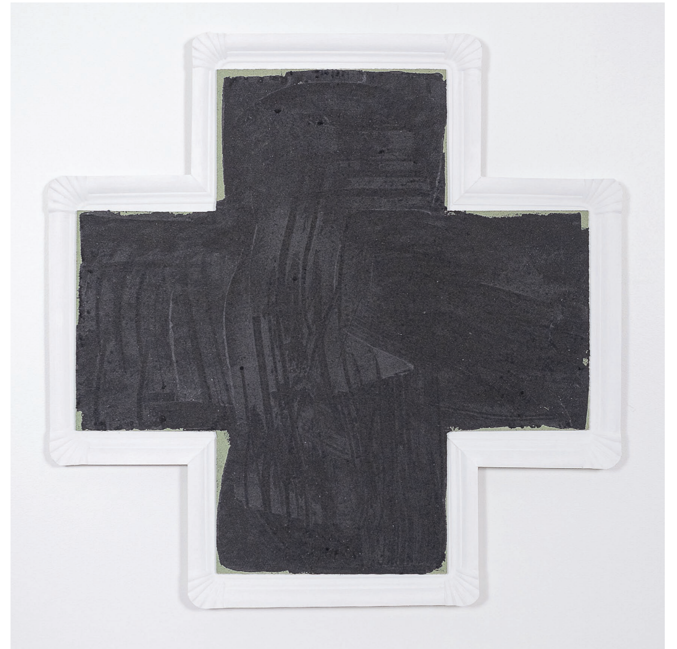
Peinture jetable , 2019. Peinture sur plateaux de service en carton. 67 × 67 × 3 cm. Disposable painting , 2019. Painting on cardboard serving trays. 67 × 67 × 3 cm.