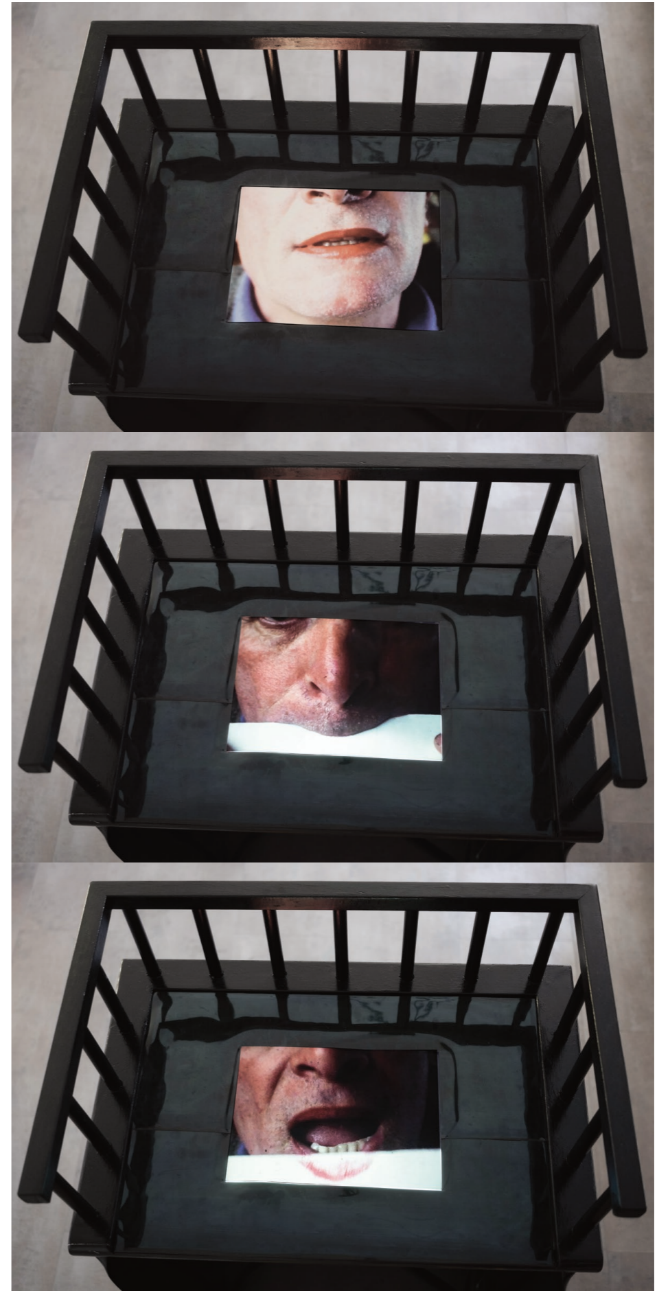
Ébarbeuse , 1996. Film Super 8 de 3 minutes en boucle. Écran plat de 25 × 18 cm. Trimmer , 1996. Looping 3-minute Super-8 film. 25 × 18 cm flat screen.