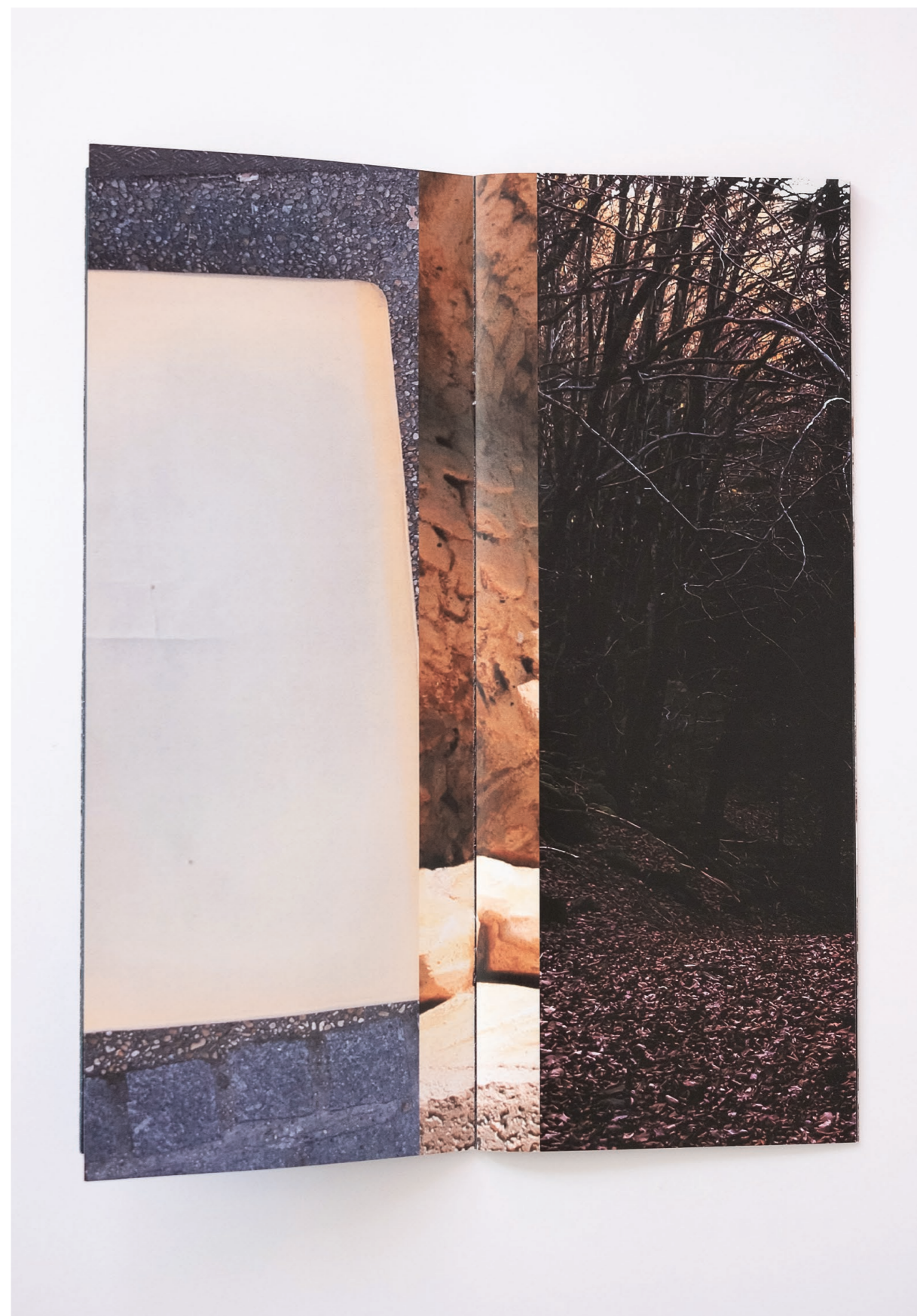
Les tranchées , 2019. Impressions sur papier. Livret de 24 pages. 15 × 37 cm. The edges , 2019. Printings on paper. 24-page booklet. 15 × 37 cm.