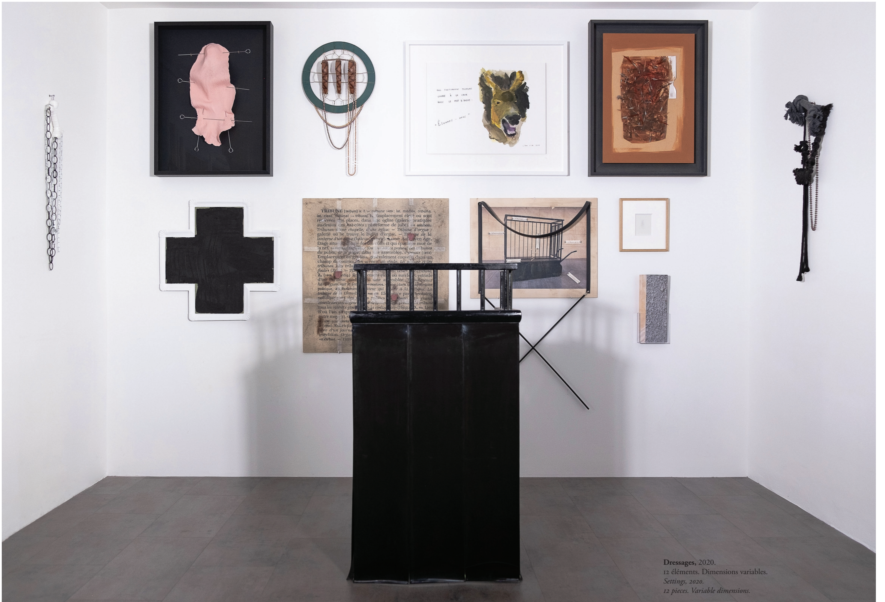
Dressages, 2020. 12 éléments. Dimensions variables. Settings, 2020. 12 pièces. Variable dimensions.