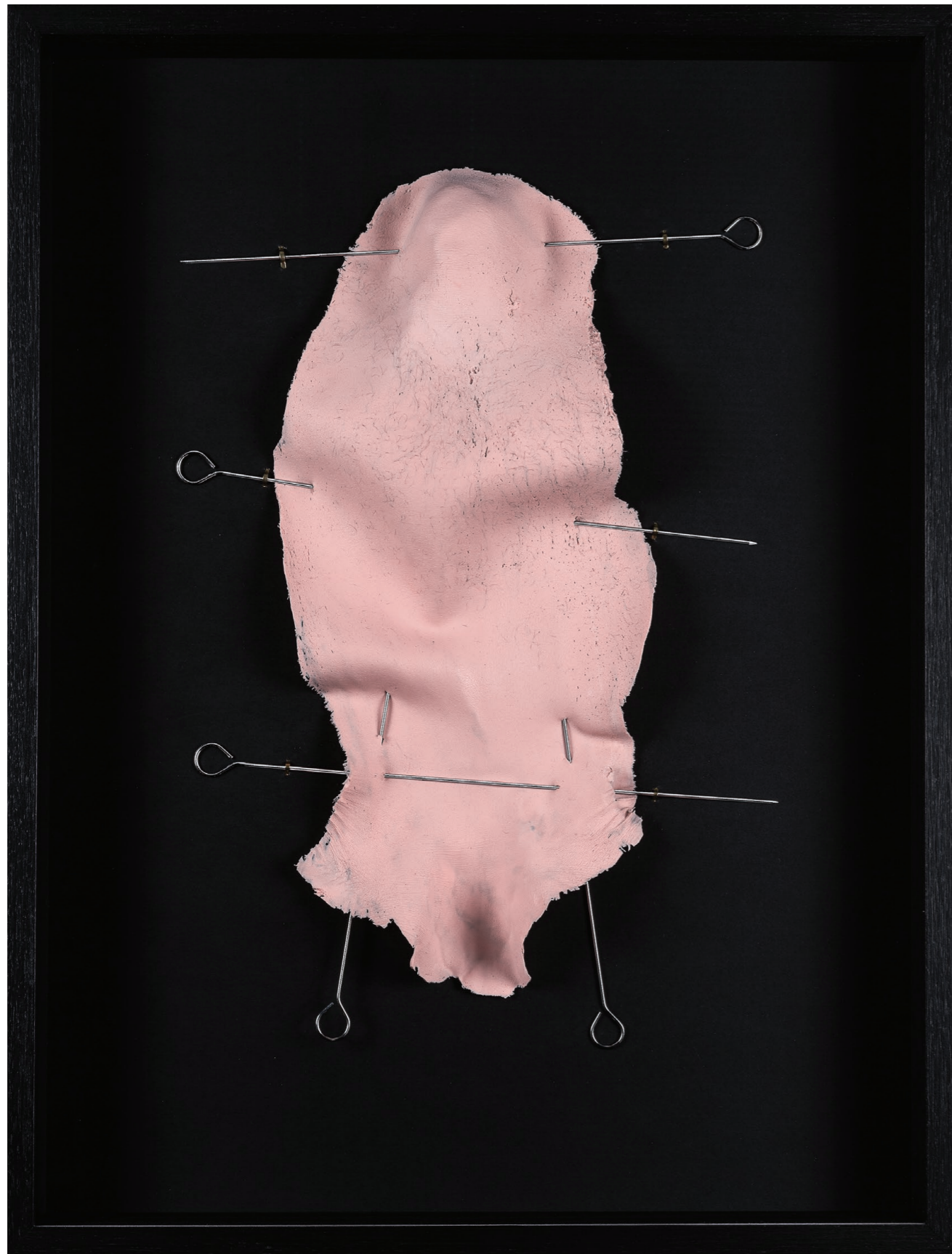
Lynchage, 2016. Moulage en silicone alimentaire, poils, piques à brochette inox. 63×83×8 cm. Lynching, 2016. Food-grade silicone casting, hairs, stainless-steel skewers. 63×83×8 cm.