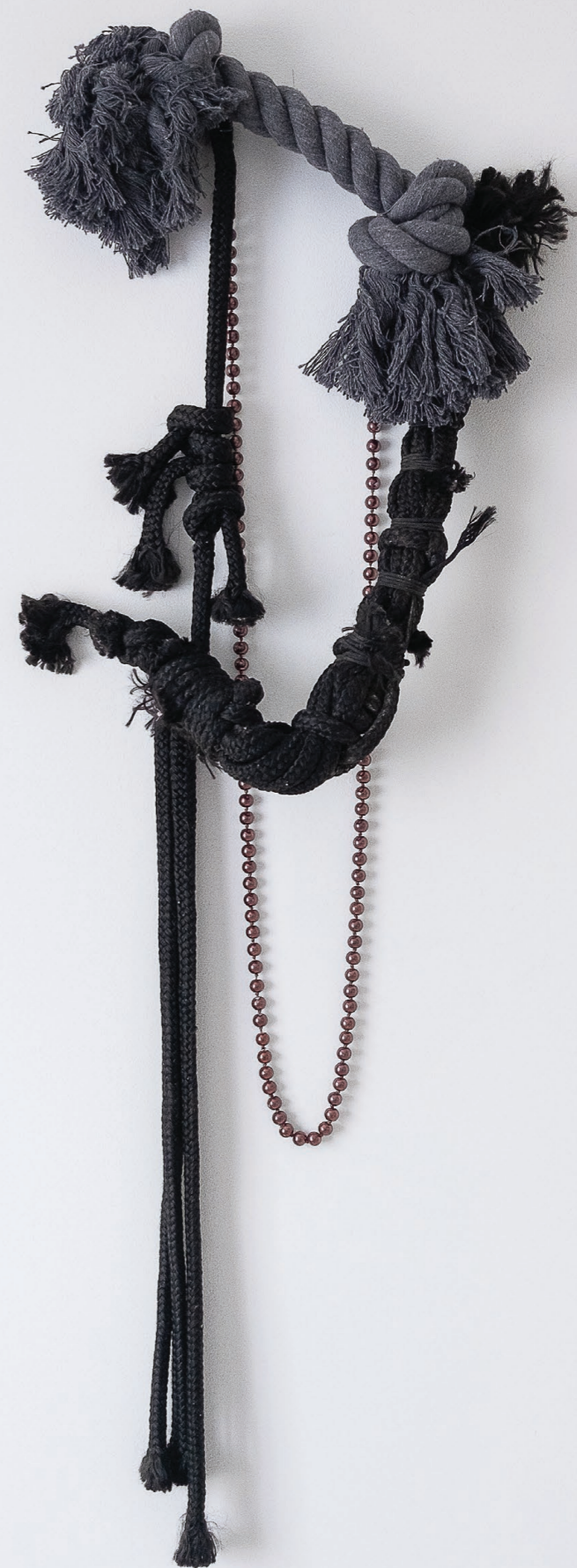
Mors, 2019. Jouet pour chien, collier, corde. 27 × 70 × 6 cm. Bit, 2019. Dog toy, collar, rope. 27 × 70 × 6 cm.