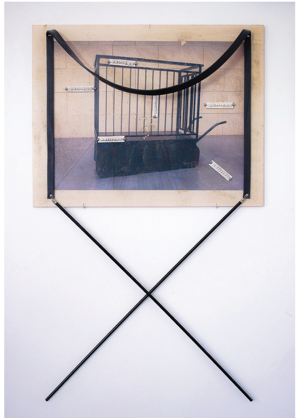
Tribune , 2018. Photographie contrecollée sur bois, lanière, manches en bois, moulages de dents en résine. 70 × 115 × 8 cm. Tribune , 2018. Laminated photograph on plywood, leather strap, handles with grip, resin casts of teeth. 70 × 115 × 8 cm.