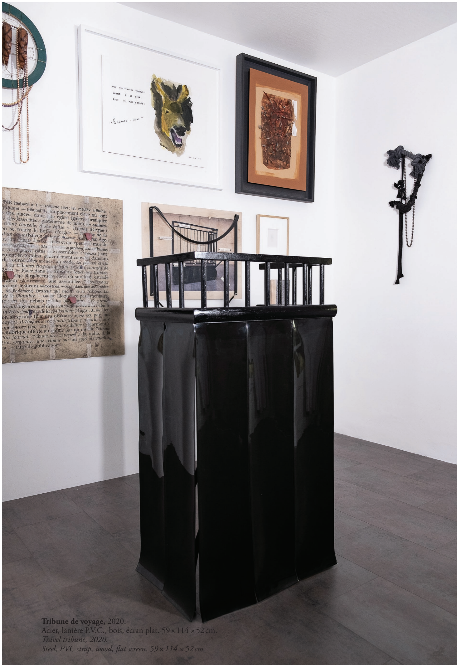
Tribune de voyage , 2020. Acier, lanière P.V.C., bois, écran plat. 59 × 114 × 52 cm. Travel tribune , 2020. Steel, PVC strap, wood, flat screen. 59 × 114 × 52 cm.