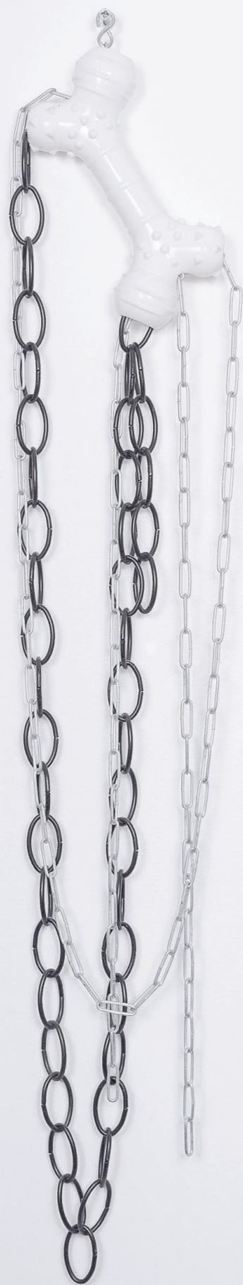
Mors, 2019. Jouet pour chien, chaînes. 18 × 40 × 4 cm. Bit, 2019. Dog toy, chains. 18 × 40 × 4 cm.