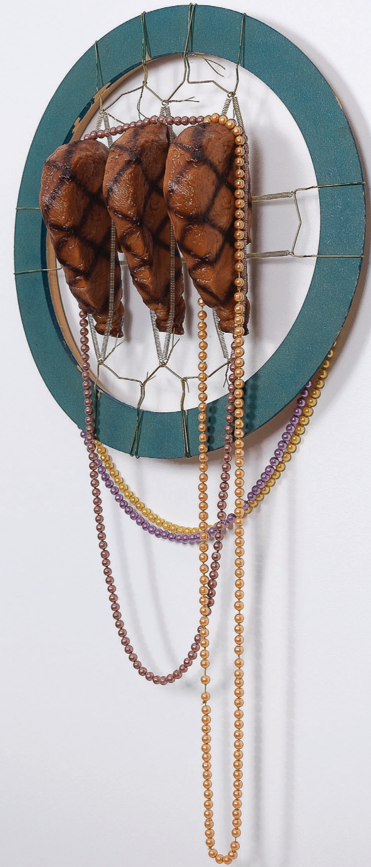
Faux-filets, 2019. Jouets pour chien, colliers, porte-assiettes muraux, bois peint. 39×75×11 cm. Strip-loins, 2019. Dog toys, collars, wall plate handlers, painted wood. 39×75×11 cm.